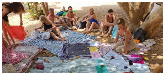
Εικόνα 1Η ομάδα που ταξίδεψε στην Τενερίφη