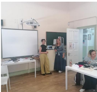
Η ομάδα που ταξίδεψε στο Δουβλίνο της Ιρλανδίας