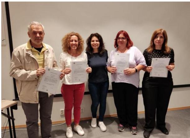
Η ομάδα που ταξίδεψε στο Όσλο της Νορβηγίας